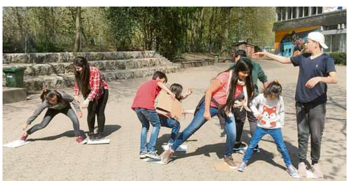
Bei Spielen lernten die Kinder sich kennen.